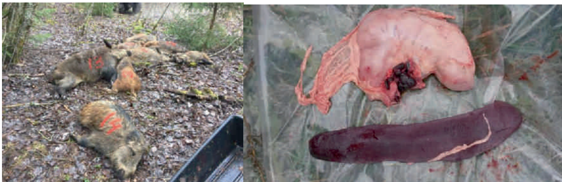
Das Beispiel aus Lettland zeigt: die ASP tötet mitunter viele Tiere einer Rotte. Besonders auffällig sind oft eine geschwollene Milz und blutige geschwollene Lymphknoten.

Bei einer Einschleppung der ASP in unsere Schwarzwildbestände wäre mit dramatischen Verlusten zu rechnen. Eine unmittelbare Bedrohung der Hausschweinebestände durch die ASP hätte enorme wirtschaftliche Folgen. Im Unterschied zur Klassischen Schweinepest steht zur Bekämpfung der ASP kein Impfstoff zur Verfügung!