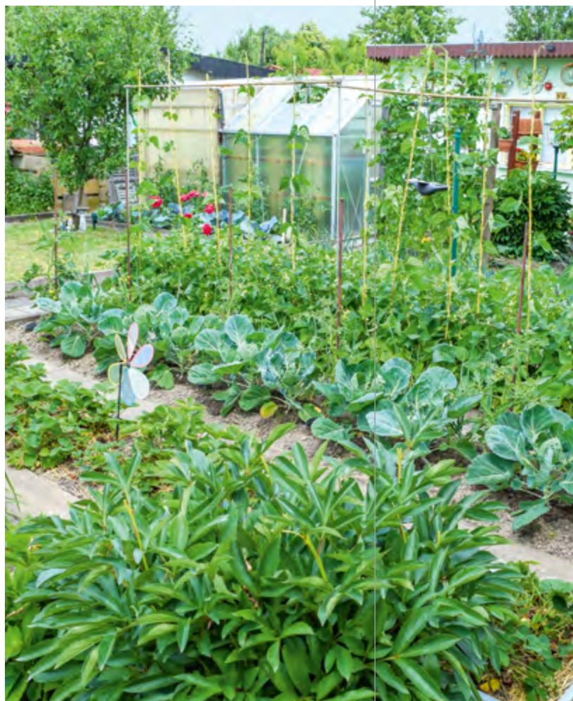
علاوه بر باغچه‌های سبزیجات و درختان میوه، گل‌ها و زیستگاه‌ها موجب تنوع گسترده گونه‌های گیاهی و حیوانی می‌شوند.

حداقل یک سوم مساحت قطعه زمین شما باید برای کشت میوه و سبزیجات برای نیاز شخصی مورد استفاده قرار گیرد. در این ارتباط باید تنوع در گیاهان قابل کشت مورد توجه قرار گیرد، شما به طور مثال مجاز نیستید همه باغ را فقط سیب زمینی بکارید.