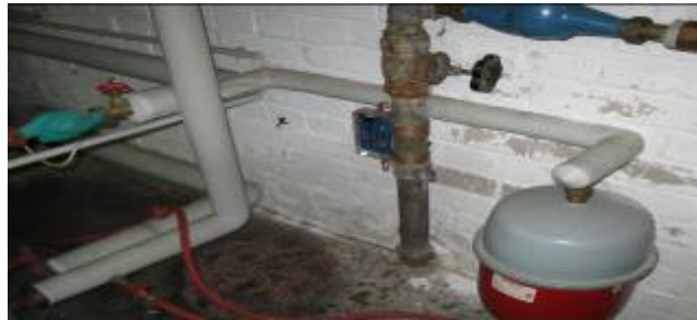
Trinkwasser-Installation in einem Wohngebäude