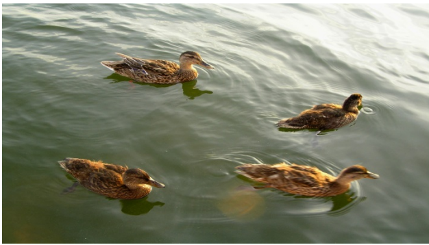
Endwirt Wassergeflügel