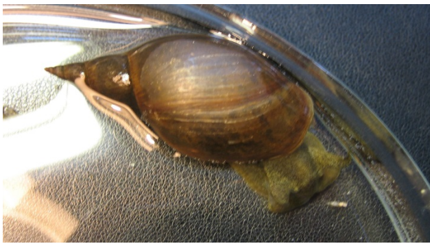
Zwischenwirt Lymnea stagnalis