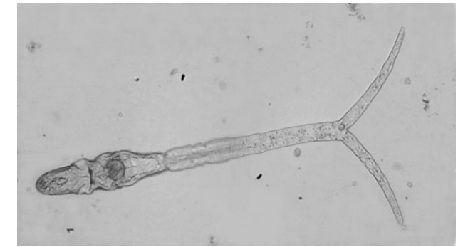
Gabelschwanz-Zerkarie, mikroskopische Aufnahme